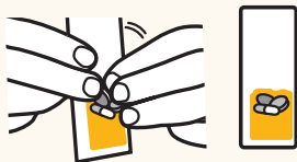
⑥果凍充分包裹藥物