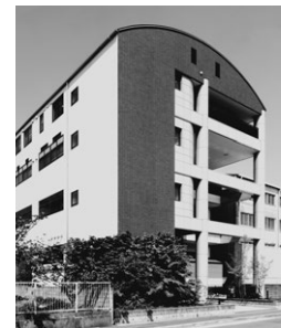
屋根がアーチ状の4階建の建物になります。